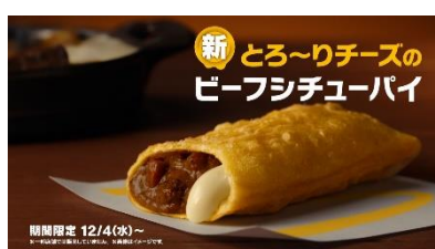
とろ〜りチーズの ビーフシチューパイ 新登場