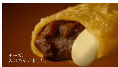
NA チーズ、入れちゃいました。