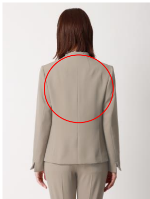
ノーカラージャケット/背中部分

冷えを感じやすい部位を中心に「GRANDWARM」の取り付け箇所を選定。その中でも体に密着する箇所に絞ることで、より効果を実感しやすい仕様になっています。