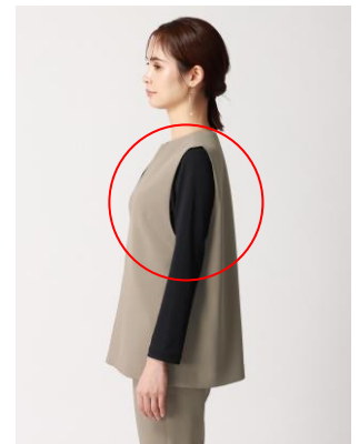
被るタイプのベスト/前後上からみぞおちまでの部分