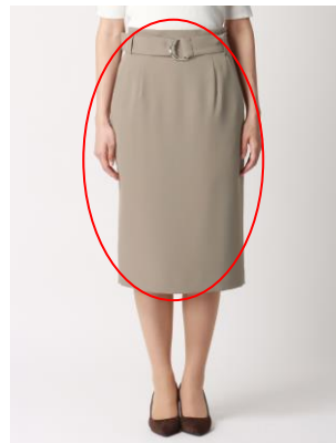
ベルト付きハイウエストスカート/全面、ポケット内側