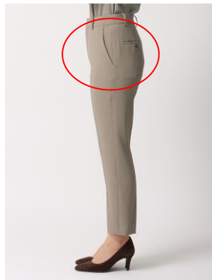
9分丈テーパードパンツ/前後のポケット内側