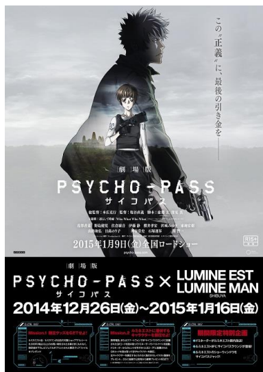
【キャンペーンポスタービジュアル】

この冬注目の人気映画の世界観をいち早く体験いただきながら、ルミネで年末年始のショッピングをお楽しみください。