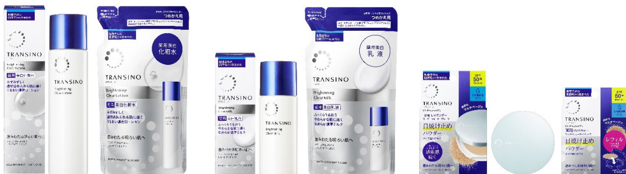
左から「トランシーノ薬用ブライトニングクリアローション／つめかえ」、「トランシーノ薬用ブライトニングクリアミルク／つめかえ」、「トランシーノ薬用UVパウダーEX／レフィル」

第一三共ヘルスケア株式会社（本社：東京都中央区、社長：内田高広）は、2025年2月7日（金）に、トランシーノ薬用スキンケアシリーズから、「トランシーノ薬用ブライトニングクリアローション」、「トランシーノ薬用ブライトニングクリアミルク」および「トランシーノ薬用UVパウダーEX」（いずれも医薬部外品）をリニューアル発売します。さらに、それぞれのつめかえタイプも新たに発売します。