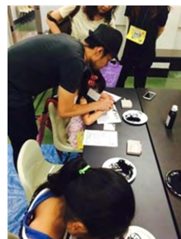
『念い書き(おもいがき)』

名 称：水槽のある空間で大切な人へメッセージを書こう ～念い書き(おもいがき)～ 開 催 日：①2015年1月6日(火) ②2015年1月7日(水) 開催時間：①15時00分～15時40分、16時00分～16時40分 17時00分～17時40分 ②15時00分～15時40分、16時00分～16時40分 開催場所：すみだステージ 参加方法：事前募集 ※公式ホームページで募集 募集期間：2014年12月22日(月)～12月30日(火) 参加料金：無料 ※入場料別途 参加対象：親子 参加定員：各回10組20名 ※応募者多数の場合は抽選 開催内容：お正月の風物詩である書初めを、書家・マエダカマリ氏と一緒に親子で参加して行います。