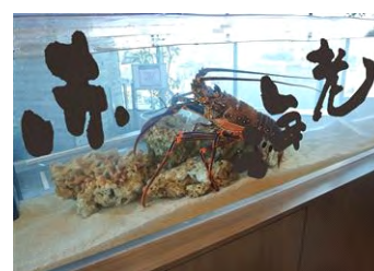
『魚魚初め(ととぞめ)』

名 称：魚魚初め(ととぞめ) 開催期間：2014年12月27日(土)～2015年2月1日(日) 開催場所：館内各所 参加方法：当日受け付け 開催内容：期間中、展示している13種類のいきもの水槽に マエダカマリ氏が書いた漢字を展示します。エント ランスで配布するカードに自分が好きな漢字を書い て投票します。「人鳥(ペンギン)」「水海月(ミズ クラゲ)」など、普段見慣れたいきもの名前も 漢字で表現すると新たな発見があるはずです。