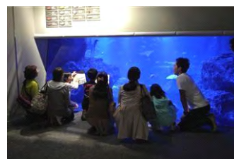
『飼育員のおさかなツアー』

名 称：飼育員のおさかなツアー 開 催 日：2015年1月10日(土)、17日(土) 24日(土)、31日(土) 全5回 開催時間：各日17時30分～18時00分 開催場所：館内各所 参加料金：無料 ※入場料別途 参加対象：小学3年生以上 参加方法：事前募集 ※公式ホームページで募集 募集期間：(1月10日、17日分)12月22日(月)～12月29日(月) (1月24日、31日分)12月22日(月)～1月14日(金) 参加定員：各回6名 ※応募者多数の場合は抽選 開催内容：飼育スタッフと一緒にいきものを観察します。 葛飾北斎の作品といきものの特徴などを解説します。