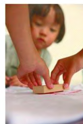
『北斎Tシャツ』 ※イメージ