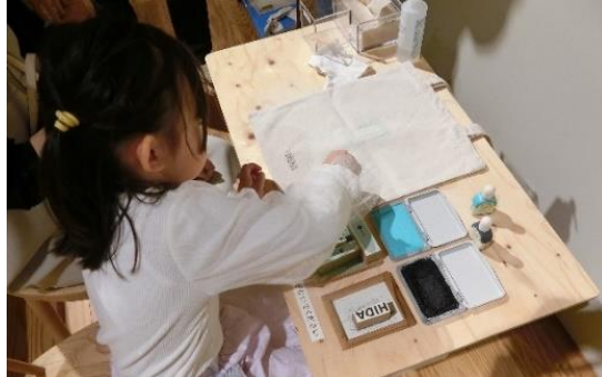
HIDA 東京神谷町店 / ワークショップイベントの様子