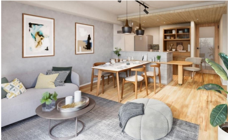
『イニシア池上パークサイドレジデンス』 E1タイプ リビング・ダイニング・キッチン完成予想CG

大和ハウスグループの株式会社コスモイニシア（本社：東京都港区、社長：高智 亮大朗、以下「コスモイニシア」）は、「家族のチームワーク醸成」をコンセプトに新たなキッチンスタイルを提案する新築分譲マンション『イニシア池上パークサイドレジデンス』（東京都大田区、総戸数36戸、販売中）を販売しており、11月16日（土）にご契約者向け「飛驒産業×コスモイニシア契約者さま限定コラボレーションイベント」を開催いたしました。