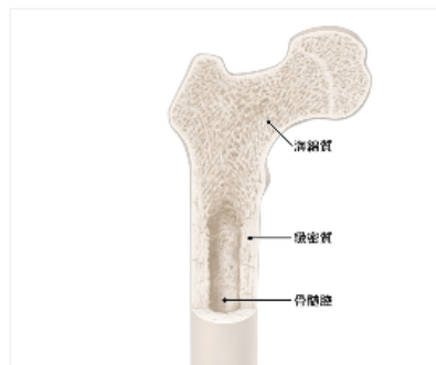
図1: 骨の内部構造 構造の特徴をよく観察してください。

また、骨は構造的な機能の他に、(4)血液を作る場の提供、(5)カルシウムなどミネラルの貯蔵庫、という重要な役割を持っています。骨の中心部の空洞は骨髓腔(こつずいくう)といい、ここで血液の主要な成分である赤血球、白血球、血小板が作られます。また骨は、体中の細胞が必要とするカルシウムを貯蔵し、細胞に安定供給するのに役立っています。