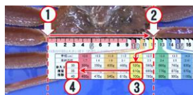
身入りスケールと測定方法