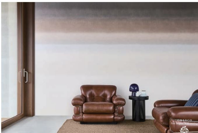
▲ INFLUENCE(インフルエンス) ¥46,200/枚(巾100cm×3m) 全7色 不燃・準不燃(1-3)

グラデーションのパネルデザインで、上下逆に施工するとイメージがガラッと変わります。ブラウン系やグリーン系の落ち着いた色合いのカラーバリエーションがあり、特注で長さの変更も可能です。