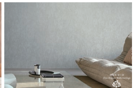
▲ OPUS(オーパス) ¥7,920/m 全14色 不燃・準不燃(1-3)