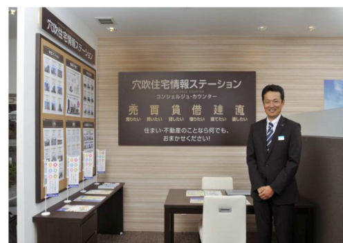
新サービス『住宅情報ステーション』 コンシェルジュ・カウンター