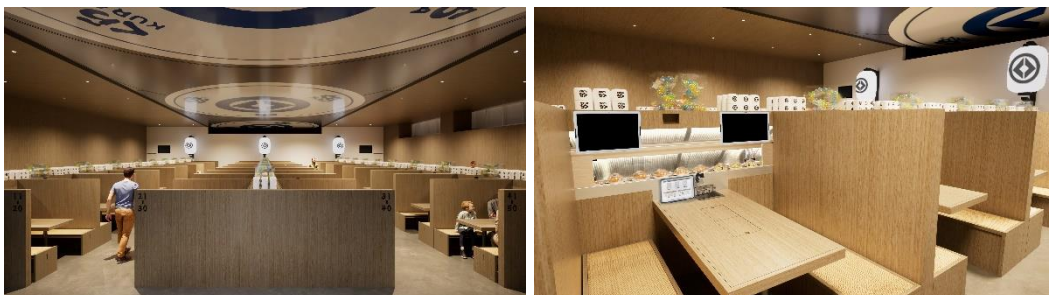
万博店舗内観イメージ

「回転ベルトは、世界を一つに。」をコンセプトに、始まりも終わりもない回転ベルトで結ばれる回転寿司を通じ、万博に訪れた世界中の皆さんが笑顔になり、楽しい食体験ができる場を提供したいと考えています。この回転ベルトで提供する商品は、くら寿司定番のお寿司をはじめ、世界の食が集結する店舗として、万博に出店する国や地域の代表的なメニューを取りそろえる予定です。席に座ると、目の前に次から次へと流れてくる世界の名物料理が楽しめます。