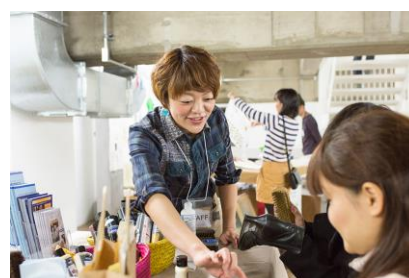
※Re Closet 第1回開催の様子 (2013年12月7日)