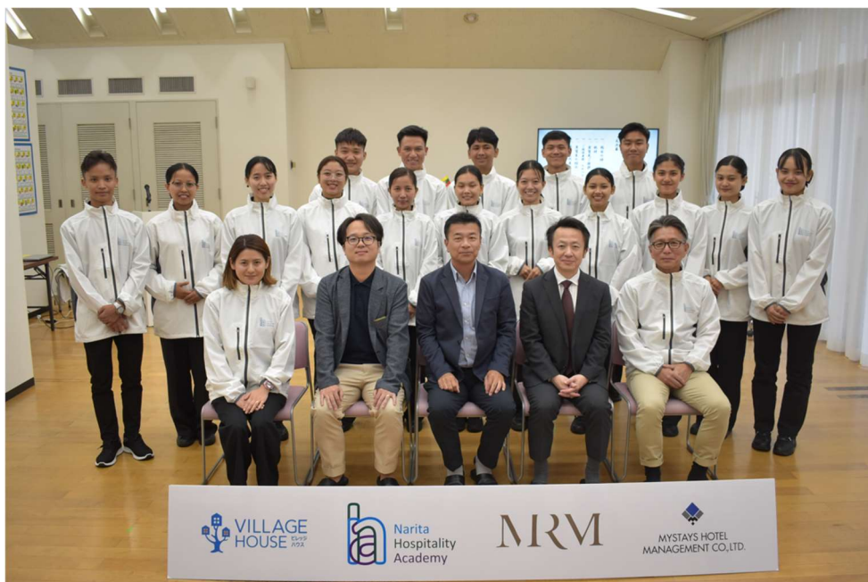
11月6日入校式での集合写真

「成田・ホスピタリティ・アカデミー」は、さまざまな業態の宿泊施設を運営するマイステイズ・ホテル・グループ(以下「MHG」)監修による外国人技能実習生向けの研修施設として2023年6月1日に開校しました。これまでに204名の実習生が講習を修了し、MHGのホテルへと配属されています。その研修の実績とノウハウを生かし、この度、初めてMHG以外の受け入れ先に向けて入国後講習を行うこととなります。