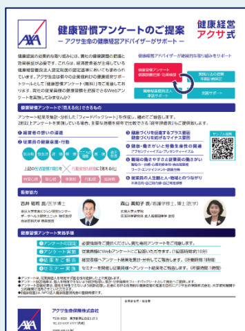
健康習慣アンケート 案内文イメージ

健康習慣に関するアンケートを行い、アンケートから明らかになった健康課題を見える化し、健康経営の視点からアドバイスを行います。アンケート結果については「健康習慣アンケート Feedback Sheet」を作成し回答いただいた企業にご報告いたします。