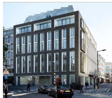
5 Hanover Square 外観パース