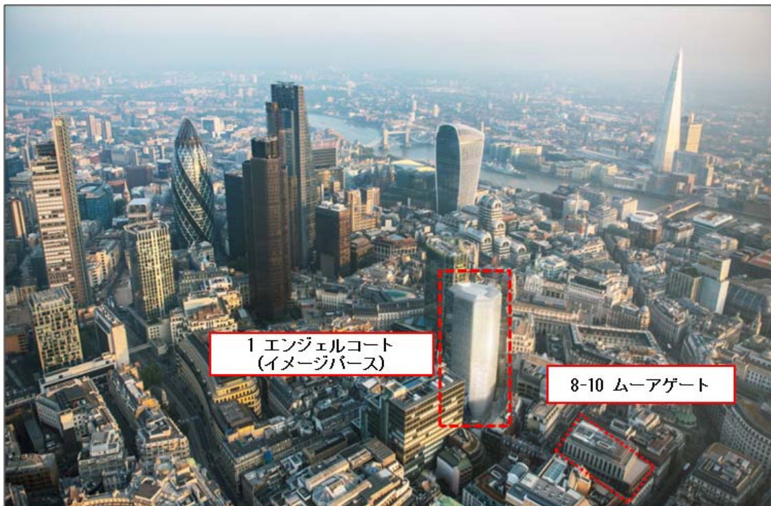
ロンドン・シティ 鳥瞰写真