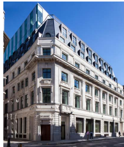
「1 エンジェルコート」イメージパース