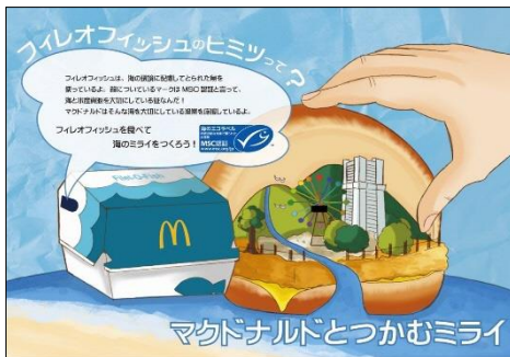
＜横浜市みどり環境局長賞作品＞