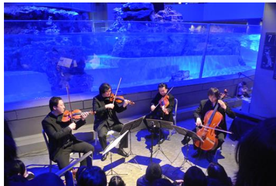
ペンギン水槽前で演奏する 新日本フィルハーモニー交響楽団