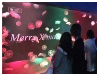
『クラゲのメリークリスマス』

展示名称：『クラゲのメリークリスマス』 展示期間：2014年12月25日(木)まで展示 展示時間：終日開催 展示場所：ミズクラゲ水槽 開催内容：ミズクラゲの水槽を期間限定で赤と緑に移り変わるクリスマスカラーの照明でライトアップします。