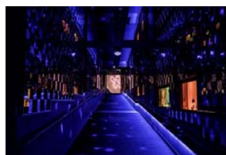
『クラゲ万華鏡トンネル』

展示名称：『クラゲ万華鏡トンネル』 展示期間：2015年1月12日(月・祝)まで開催 展示時間：終日開催 展示内容：全長50メートルのスロープに、色鮮やかな照明に照らされた8つのクラゲ水槽を設置し、壁と天井の3面に約5,000枚の四角形や三角形の鏡を敷き詰めることにより、万華鏡と合わせ鏡の中を歩いているような体験ができる展示です。浮遊するクラゲと照明によって、常に表情を変えるトンネル内で、クラゲと一緒に鏡の中の世界を漂っているような幻想的な浮遊体験ができます。