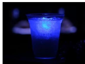
『ブルーナイトカクテル』

商品名：『ブルーナイトカクテル』 販売価格：620円(税込み) ※ノンアルコールは500円(税込み) 販売期間：2015年1月12日(月・祝)まで販売 販売時間：18時00分～21時00分 販売場所：5階 ペンギンカフェ 商品内容：青く光るLEDの入った氷型キューブが浮かぶ柑橘リキュールのカクテルです。 カクテルを片手に夜の演奏会をお楽しみください。