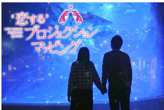
『恋する投影マッピング』 ※イメージ