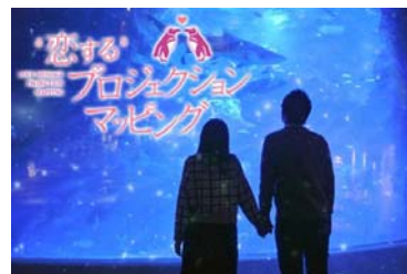
『恋するプロジェクションマッピング』 ※イメージ

開催内容：高さ6メートル、幅9メートルの「東京大水槽」に 皆さまから募集したメッセージを、プロジェク ションマッピングで上映します。