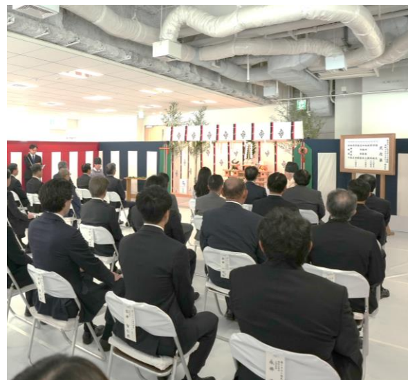
「東京ワールドゲート赤坂」 竣工式の様子

「東京ワールドゲート赤坂」は、東京圏国家戦略特別区域(通称「国家戦略特区」)における国家戦略都市計画建築物等整備事業として認定を受けた、虎ノ門・赤坂エリアの国際競争力強化を推進する大型複合開発プロジェクトです。街区コンセプトに「Next Destination」を掲げ、従業員エンゲージメントの向上に資するオフィスフロアの提供や、国際水準のホテルおよびサービスアパートメントの展開を予定しています。加えて、赤坂の地に根ざした歴史文化を発信する施設の開設、大規模緑地の整備などを通じて、ビジネスと観光の両面から、世界と日本をつなげるゲートの機能を担うような拠点づくりを進めております。