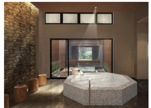
男性風呂「真珠の湯」(イメージ)

真珠を育むアコヤ貝の外套膜から抽出したコラーゲンで、肌を包みうるおいを保つ働きをします。