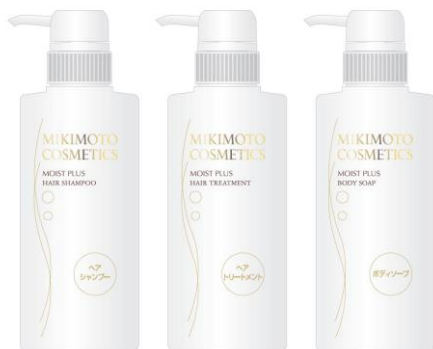
女性用 インバスアメニティ モイストプラスシリーズ

ミキモト コスメティックスが当施設のために開発した美容乳液です。「ネムノキ樹皮エキス*1」と「パールコンキオリン®*2*5」などの美容成分が深いうるおいを与え、ハリと弾力のあるしなやかな肌に整えます。