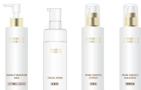
女性用 スキンケアアメニティ