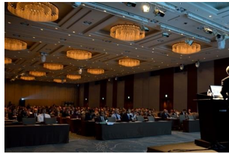
フォーラム会場の様子