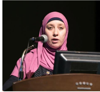
オマーン国営石油会社