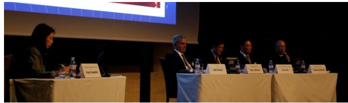
パネル・ディスカッション(1日目)