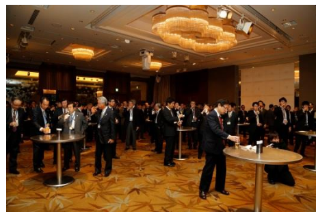
ネットワーキング・レセプション開催風景