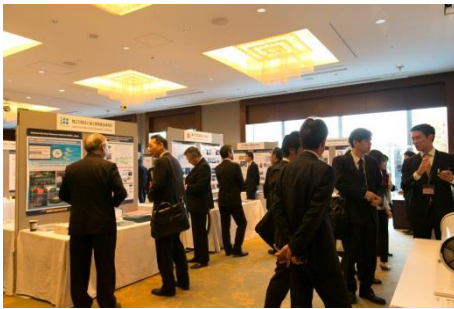
企業展示会の様子