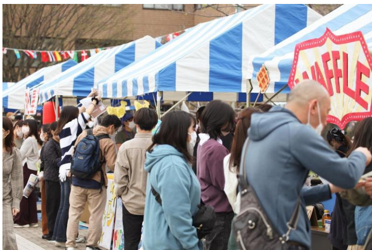
▲ 過去の開催の様子(写真左) / 「第38回浜風祭」ポスター(写真右)

【特設サイト】 https://www.kandagaigo.ac.jp/kuis/main/campuslife/hamasai/