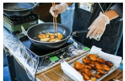
▲ 昨年のテント販売の様子 3