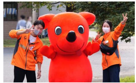
▲ 千葉県マスコットキャラクター チーバくん