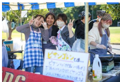
▲ 昨年のテント販売の様子 2