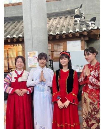
▲ チェキ MULC イメージ