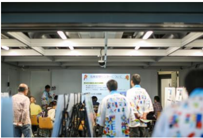
▲ 福島ブースイメージ