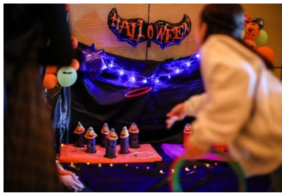
▲ ハロウィン縁日イメージ