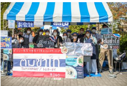
▲ 昨年のテント販売の様子 1

販売物例：フィリピン料理「タホ」、タイ料理「グリーンカレー」、ベトナムスイーツ「チェー」、パエリア風炊き込みご飯、その他韓国料理、中国料理など