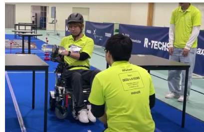
【2月に行われたチャレンジ大会の様子】