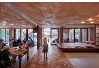
複合型福祉施設「深川えんみち」 社会福祉法人 聖教主福祉会+NPO法人 地域で育つ元気な子+JAMZA (受賞番号：24G151229)