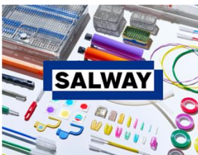
再生処理プロダクトブランド「SALWAY」 株式会社名優 (受賞番号：24G161324)