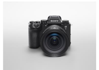
レンズ交換式デジタル一眼カメラ「α9 III」 ソニーグループ株式会社 + ソニー株式会社 (受賞番号：24G060337)