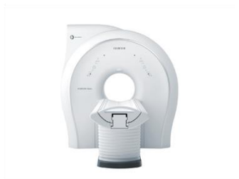
MRIシステム「ECHELON Smart ZeroHelium」 富士フイルム株式会社 (受賞番号：24G080615)