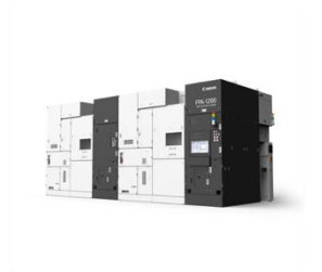
半導体製造装置「FPA-1200NZ2C」 キヤノン株式会社 (受賞番号：24G080574)