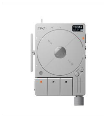
多機能ポータブルオーディオレコーダー「teenage engineering TP-7 field recorder」 株式会社メディア・インテグレーション (受賞番号：24G060290)