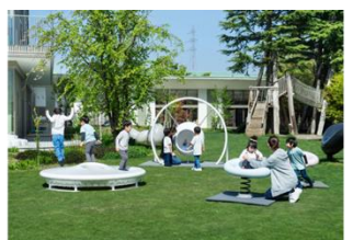
遊具研究プロジェクト「RESILIENCE PLAYGROUND プロジェクト」 株式会社ジャクエツ (受賞番号：24G191506)