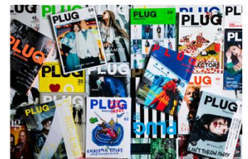
雑誌「プラグマガジン」 有限会社サーブ (受賞番号：24G161347)