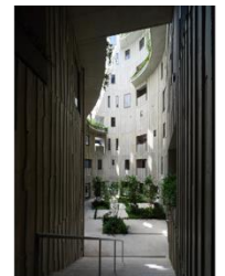
集合住宅「天神町place」 株式会社寿企業+有有限会社伊藤博之建築設計事務所 (受賞番号：24G131092)