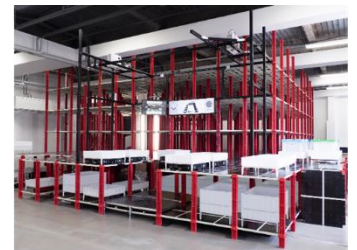
自動倉庫ソリューション「ラビュタASRS」 ラビュタロボティクス株式会社 (受賞番号：24G110915)