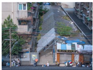
都市空間再生プロジェクト「CACP "Designing?"」 YIIIE Co., Ltd. (受賞番号：24G151253)