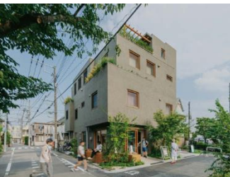
障害者シェアハウス+シェア店舗「はちくりはうす」 株式会社ブルスタジオ+竹村真紀 + 特定非営利活動法人はちくりうす (受賞番号：24G120995)