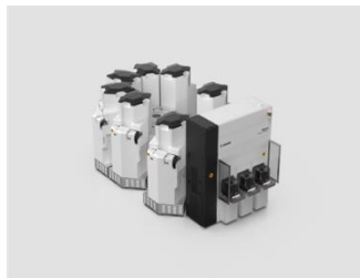
半導体製造装置「Adastra」 キヤノンアナネルバ株式会社 (受賞番号：24G080575)