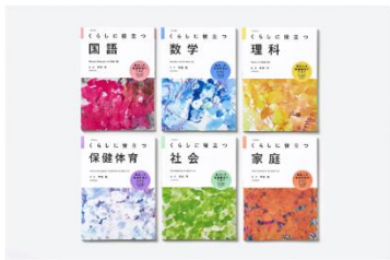
教科書「暮らしに役立つ」シリーズ 株式会社ADDIX (受賞番号：24G030129)