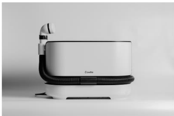
介護用洗身用具「スイトルボディ SWB-1000JP」 株式会社シリウス (受賞番号：24G020096)