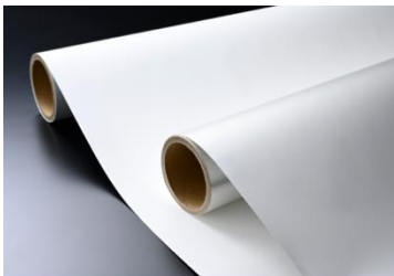
放射冷却素材「SPACECOOL」 SPACECOOL株式会社 (受賞番号：24G080641)