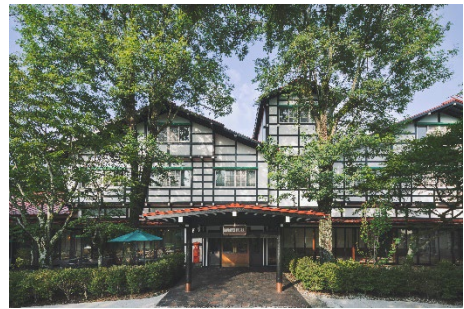
アルプス館 イメージ

1936 年（昭和 11 年）に建てられ、2018 年（平成 30 年）に国の登録有形文化財に登録された「アルプス館」は、軽井沢の景観に調和したハーフ・ティンバー風の外観意匠や、和洋折衷の室内意匠などから、戦前・戦後を通じ、現在に至るまで数多くの著名人や政界人などに愛されてきました。本改修・改築事業では、「130 年の時をつなぐ万平ホスピタリティ～文化・歴史・自然を紡ぐ～」をコンセプトに、日本ホテル史上における貴重な歴史的建造物としての伝統を守り、長く未来にわたりクラシックホテルとしての格式ある滞在をお届けすることを目指してまいります。