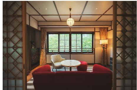
アルプス館 客室イメージ

当ホテルのシンボルでもあるアルプス館は、全 12 室の客室に加え、ホテル伝統のフランス料理を新たなエッセンスと共に楽しみいただけるメインダイニングルーム、軽井沢の自然を楽しむカフェテラス、オーセンティックなバー、レセプションなどから成り、ホテルにいらっしゃる皆様を、これまでと変わらない姿でお迎えいたします。