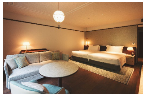
碓氷館 客室イメージ

新築したバンケット棟では、大きな窓が印象的な「桜」の間にて、軽井沢の自然を間近に感じられる華やかな婚礼・宴会をお受けいたします。