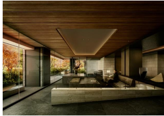
エントランスラウンジ (イメージ)