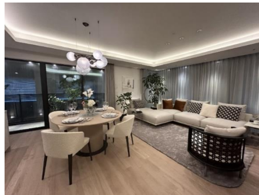
「ザ・ライオンズギャラリー新宿」コンセプトルーム

「ザ・ライオンズギャラリー新宿」では、都内の販売物件に関する建物模型やコンセプトルームをご覧いただけるほか、VRによる内覧体験や商談スペースを設置しています。コンセプトルームは、洗練・上質・モダンデザイン・ラウンドデザイン（曲線）をテーマに「THE LIONS」の住まいを表現。ブランドのメインターゲットとなる「パワーカップル」の感性に響くような、モダンラグジュアリーをベースにした上質で洗練された暮らしのイメージをお伝えします。