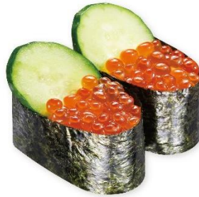
いくら 115円 販売期間:10月4日(金)~10月14日(月)