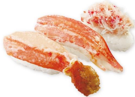
かに三種盛り 390円 ※本ズワイガニ爪下・本ズワイガニ開き・かに身 販売期間:10月4日(金)~10月14日(月) ※お持ち帰り不可