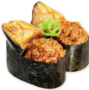
マーボー茄子 115円 販売期間:10月4日(金)~10月27日(日)

むね肉の表面全体に甘酢ダレを漬け、注文が入ってから揚げることで、中はしっかりと香ばしく、また、卵入りの衣を使用することで外はサクサク食感に仕上げられています。シャリに合うよう酸味を抑えた甘みのあるタルタルソースがアクセントになっています。