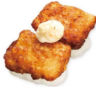
チキン南蛮 165円 販売期間:10月4日(金)~10月27日(日) ※お持ち帰り不可

高級魚であるヒラマサの中でも大型で脂乗りの良いものを厳選し、活〆。店内で皮引きとスライスを行うことで、鮮度の高い状態を保ち、ヒラマサならではの引き締まった身質とほどよい脂乗りが堪能できます。