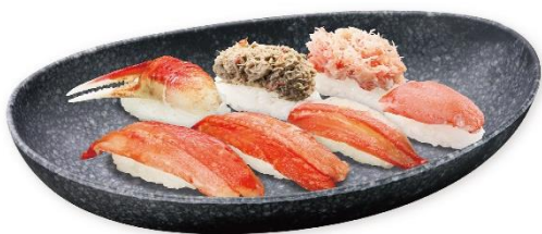
贅沢かに盛り合わせ 1,490円 販売期間:10月4日(金)~10月14日(月) ※本ズワイガニ大(二貫)・本ズワイガニ開き・丸ズワイガニ爪下・本ズワイガニ爪・かに身かにみそ和え・かに身 ※お持ち帰り不可

北海道産ホタテとハマグリに加え、北海道産昆布や香味野菜などの旨みが効いたスープを使用。トッピングに使用するアサリの旨みと合わせ、貝の濃厚な旨みが口いっぱい広がります。麺は多加水製法により、ツルツルでもちもちとした食感に仕上げられています。