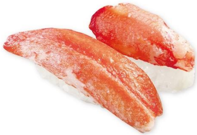
かに食べ比べ 345円 ※本ズワイガニ開き・丸ズワイガニ爪下 販売期間:10月4日(金)~10月14日(月)