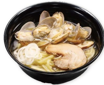
貝だしらーめん 490円 販売期間:10月4日(金)~無くなり次第終了 ※お持ち帰り不可