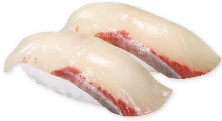
鹿児島県 活〆ひらまさ 280円 販売期間:10月4日(金)~10月27日(日)

高級魚であるヒラマサの中でも大型で脂乗りの良いものを厳選し、活〆。店内で皮引きとスライスを行うことで、鮮度の高い状態を保ち、ヒラマサならではの引き締まった身質とほどよい脂乗りが堪能できます。