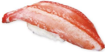
ポイル本ズワイガニ大(一貫) 280円 販売期間:10月4日(金)~10月14日(月)