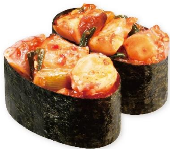
たこキムチ 115円 販売期間:10月4日(金)~10月27日(日)