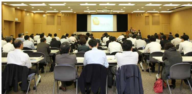
Bambang 石炭業務監理局長 (インドネシア)

本セミナーには経済産業省資源エネルギー庁、豪州クィーンズランド州政府、ロシア大使館の他、資源エネルギー関連会社、鉄鋼会社、電力会社、商社、報道関係者等、総勢 90 名の石炭事業関係者が参加する盛大な報告会となりました。インドネシア鉱物石炭総局のバンバン石炭事業管理局長の講演では「石炭鉱区の契約・ライセンスの動向」「低品位炭の活用に関わる規制やインセンティブ」等について質疑応答が行われました。