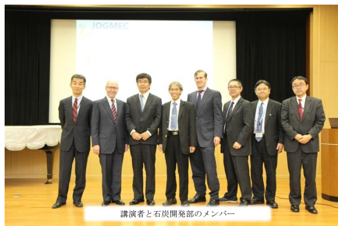
講演者と石炭開発部のメンバー

JOGMEC は今後とも、皆様からのご要望、ご意見等を踏まえ、情報提供の強化を含めた開発支援ツールをより一層充実していきたいと考えております。