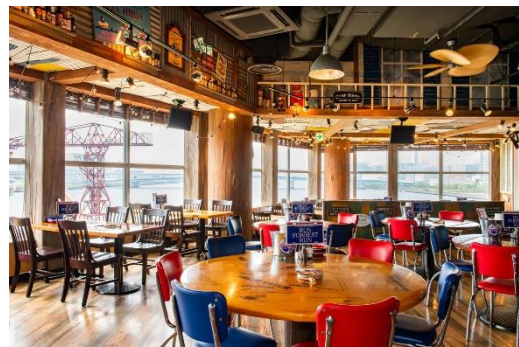
ららぽーと豊洲店