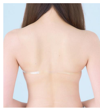
③ 透明バックストラップ付属 背中をきれいに見せながらも、 はがれ落ちる不安を軽減