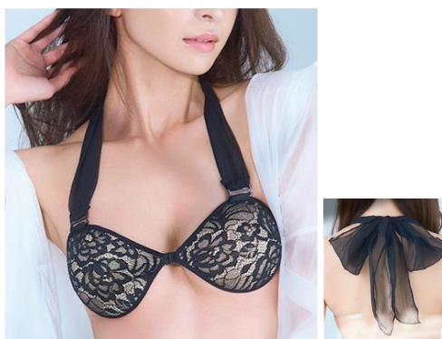
② ホルターネックストラップ使用 バストを引き上げ、胸をきれい に見せる