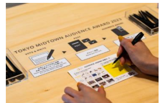
▲昨年のオーディエンス賞の様子

※投票結果は11月下旬にTOKYO MIDTOWN AWARD オフィシャルサイトにて発表