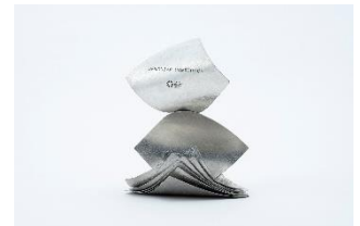
▲TOKYO MIDTOWN AWARD 2024トロフィー

TOKYO MIDTOWN AWARD では、年度ごとにオリジナルのトロフィーを制作しています。2024年度のトロフィーはデザインコンペの審査員、篠原ともえ氏がデザインした作品です。