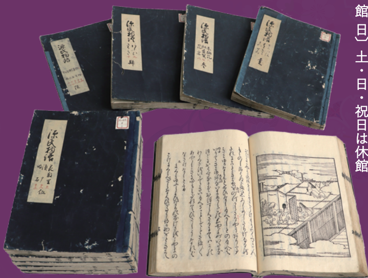
松坂家旧蔵 絵入源氏物語 (愛知大学図書館蔵)