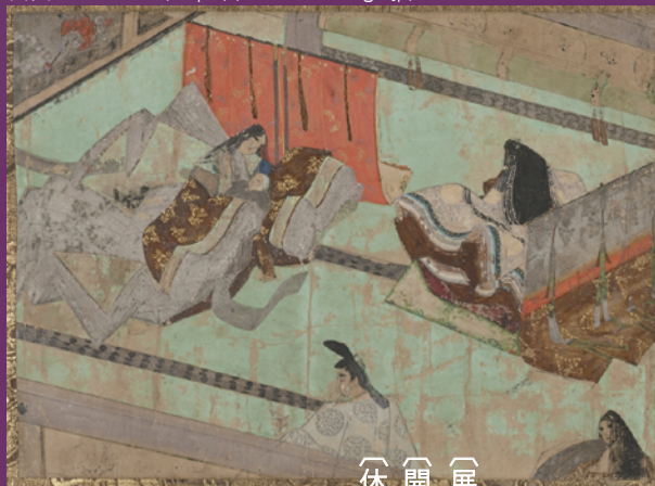
紫式部日記絵巻断簡 (東京国立博物館蔵)

〔展示会場〕愛知大学豊橋校舎 大学記念館 〔開館時間〕10時～16時(12～13時は昼休みのため閉館) 〔休館日〕土・日・祝日は休館