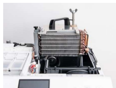
熱交換器を持ち上げて固定