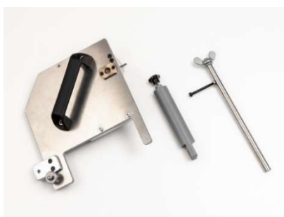
新たに開発した専用治具