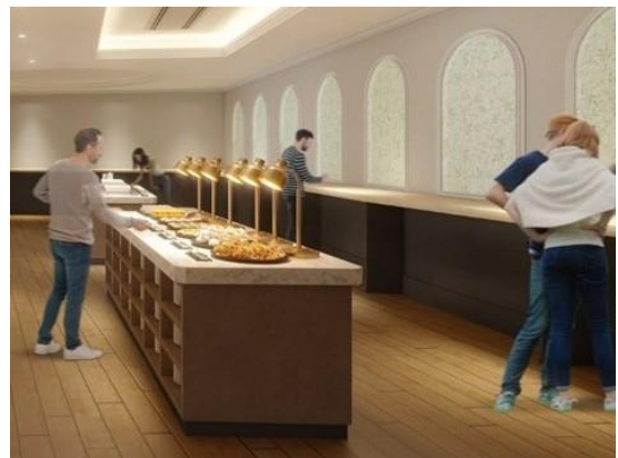
スタンディングカウンター（右端）イメージ