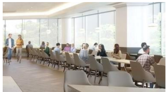
可動式の客席イメージ

さまざまなお客様のニーズにお応えするため、可動式の客席を採用します。1名様向けのカウンター席のほか、ファミリーやグループ向けに最大18名様まで横並びでのご案内が可能です。