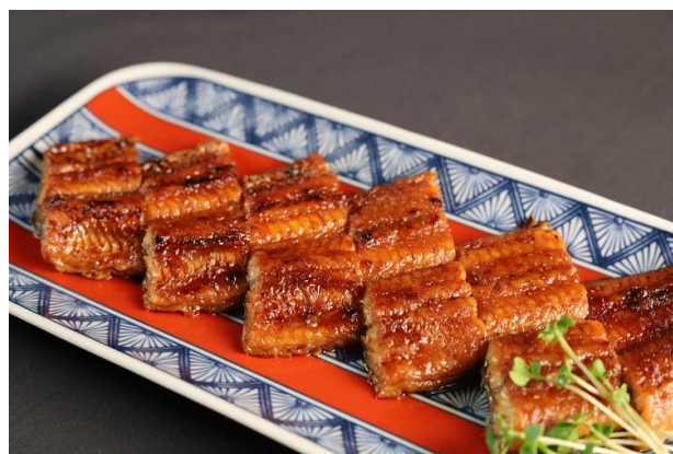
鰻の蒲焼きイメージ

改装工事中はご迷惑をお掛けしますが、何卒ご理解のほど、よろしくお願い申し上げます。