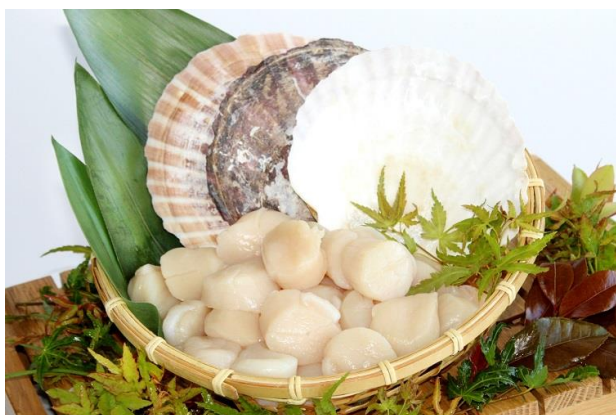
北海道 紋別産ほたてイメージ

リニューアル後は、ビュッフェ台が広がるため、人気の海鮮コーナーに新メニュー「北海道 紋別産ほたて」を追加します。プランクトンが豊富なオホーツク海で育つ「北海道 紋別産ほたて」は、旨味が凝縮され引き締まった身が特徴です。貝柱は大きく食べ応えがあり、やわらかな甘みが得も言われぬ美味しさで、ぜひお試しください。ほかに日替わりメニューとして「北海道 紋別産ほたて」の「焼きほたて」もしくは「鰻の蒲焼」のどちらかを提供いたします。ほたてならではの甘味と旨味を最大限に楽しめる「焼きほたて」、じっくり蒸して程よい脂のりになった鰻をさらに香ばしく焼き上げ甘辛たれを絡めた「鰻の蒲焼」もお楽しみください。