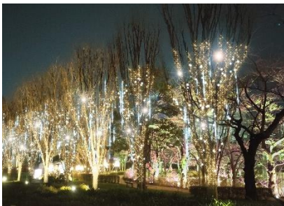
(左)クリスマスの訪れを待ち望む煌びやかな街に、しんと雪が降り始めるシーンを表現。繊細な雪の美しさを感じさせます。