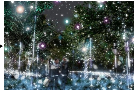
(右)幻想的な雪景色を思わせるエリア。ホワイトの光とミストの演出で、まるで雪の世界にたたずんでいるような感覚を味わえます。期間限定で雪が降る演出も登場します。