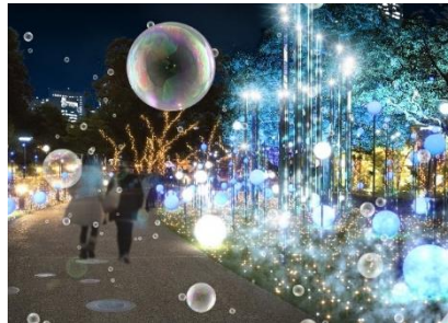
(中央)街に雪が降り積もっていく様子をゴールドとホワイトの光で表現。高さ約 8m のミラータワーから織りなす迫力と奥行きのある光の演出が華やかな空間を作り出します。期間限定のしゃぼん玉演出は必見。