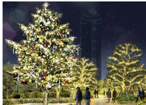
▲Timeless Gold Tree(イメージ)