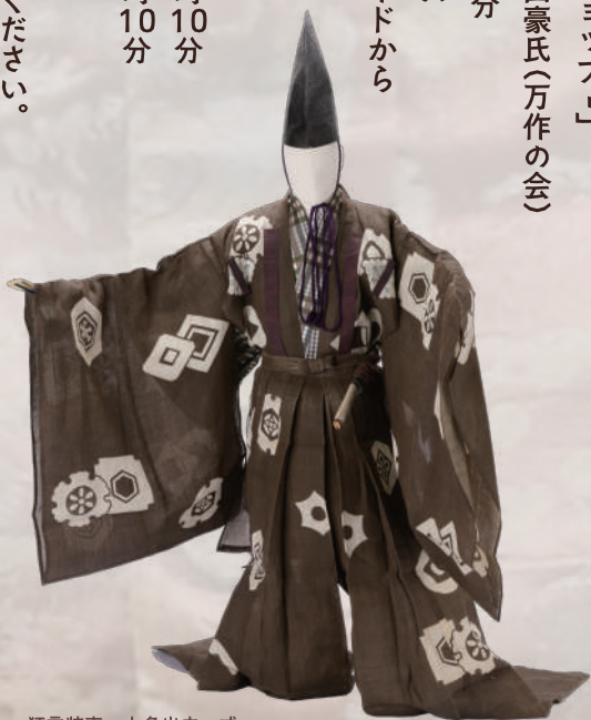
狂言装束 大名出立一式 早稲田大学演劇博物館所蔵