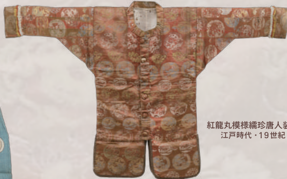
紅龍丸模様縹珍唐人装束 江戸時代・19世紀