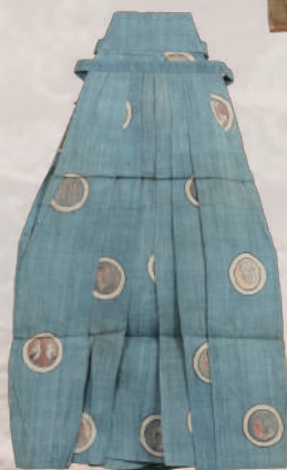
浅葱麻地丸紋散らし模様半袴 江戸時代・19世紀