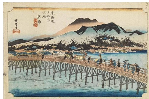
<歌川広重 東海道五十三次 京師 三條大橋 江戸時代 天保4～5年(1833～34)岡田美術館蔵>