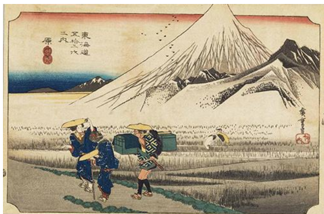
<歌川広重 東海道五十三次 原 朝之富士 江戸時代 天保4～5年(1833～34)岡田美術館蔵>