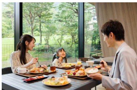
<箱根ホテル小涌園 フォンテンブロー ランチビュッフェ>