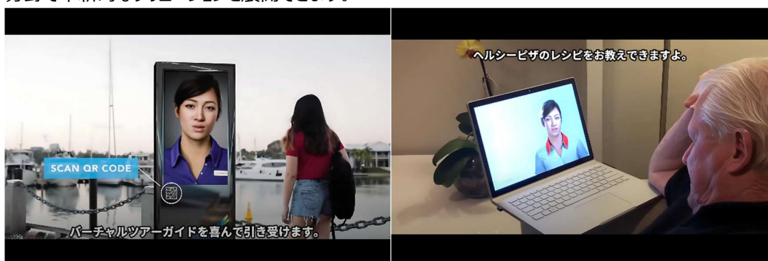
（図 2,3：デジタルヒューマン技術の活用シーン例）

一般的にデジタルヒューマン技術は、高精度・高解像度であるがゆえに、動作端末の性能が展開の障壁となりがちですが、デジタルヒューマン社は、独自の『デジタルヒューマン プラットフォーム』を提供することで、表示端末の GPU 性能に依存せずにデジタルヒューマンを生き活きと動作させ、オンラインでリアルタイム対話を実現します。これにより、企業はカスタマーサポート、マーケティング、エンターテインメントなど、幅広い分野で革新的なソリューションを展開できます。