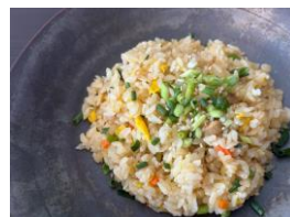
写真はメニューの一例です。