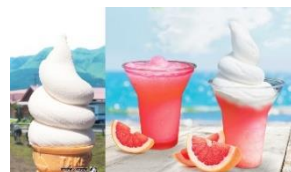
写真はメニューの一例です。