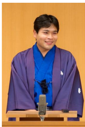
上方落語(日本語) 笑福亭喬介 (しょうふくていきょうすけ)