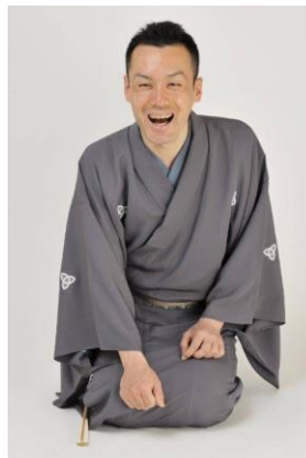
上方落語(日本語) 桂阿か枝 (かつらあかし)