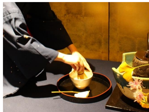
<茶道ライブパフォーマンス>