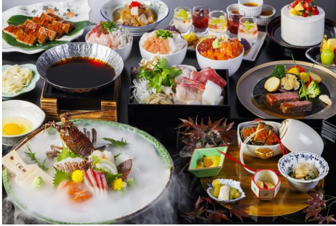
<秋の味覚 豪華特選会席>