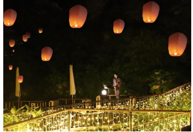
<Lantern JAZZ Night イメージ>

箱根小涌園 天悠(所在地:神奈川県足柄下郡箱根町二ノ平 1297 支配人:清水敬三)では秋の味覚を堪能する宿泊プランと芸術や文化に触れながら五感で楽しむ贅沢な秋の過ごし方をご提案いたします。