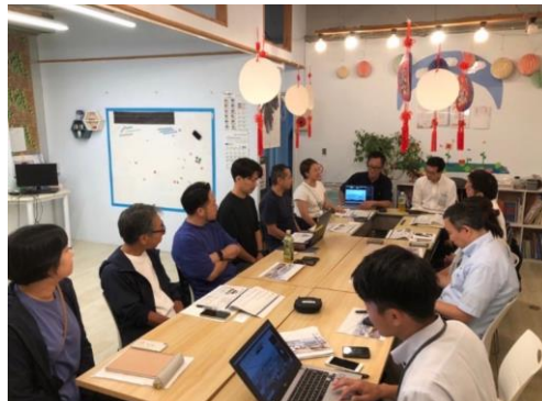
空想するカイギ（イメージ）