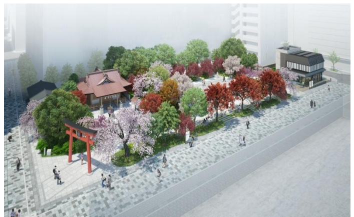
(仮称) 福德の森完成パース