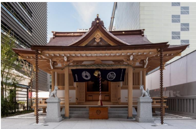
福德神社完成写真

広場地下には、地下通路を介してCOREDO 室町2と繋がる商業空間を設け、地上のみならず地下にも賑わいを創出します。