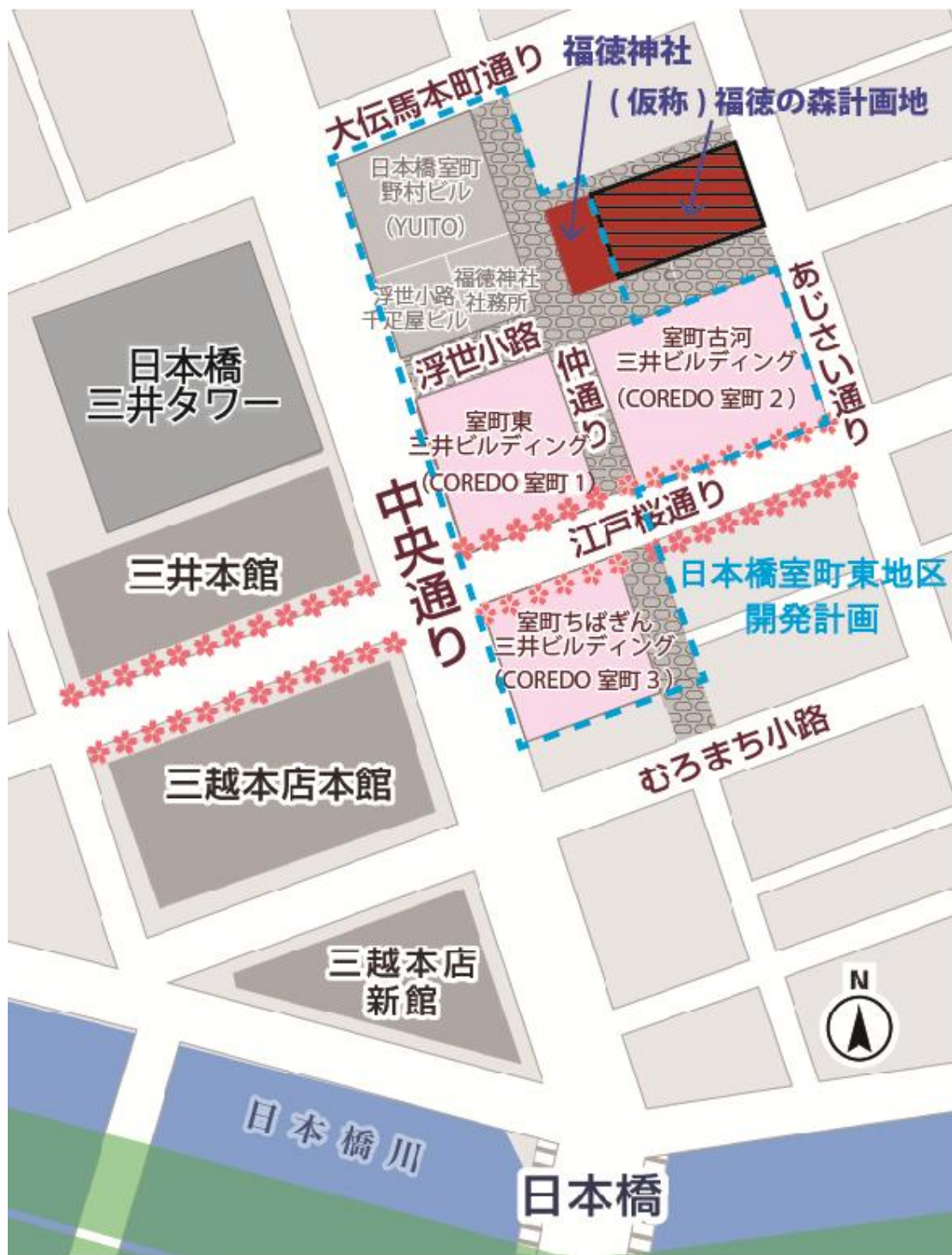
<添付資料 2> 位置図