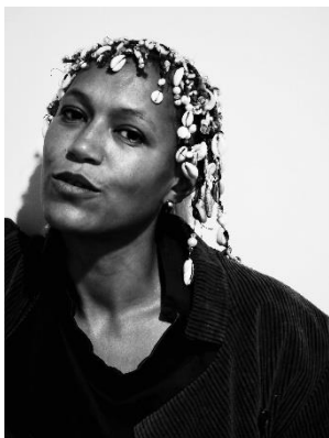
アニシア・ユゼイマン / Anisia Uzeyman

女優、劇作家、映画監督。ルワンダ生まれ。フランスの高等演劇学校で演劇を学ぶ。ユゼイマンの監督デビュー作「Dreamstates」は全編が iPhone で撮影され、ソウル・ウィリアムズが出演。この映画は 2016 年のロサンゼルス映画祭で上映された。彼女はまた、数多くのミュージックビデオも監督している。女優としては、映画「Aujourd'hui-TEY」や、ゲティ・フェリン監督の長編作「Ayiti Mon Amour」(2017 年のトロント国際映画祭で初上映)に出演。ユゼイマンは自身のオリジナル脚本を詩的に表現した「Saolomea, Saolomea」を 2021 年に出版している。