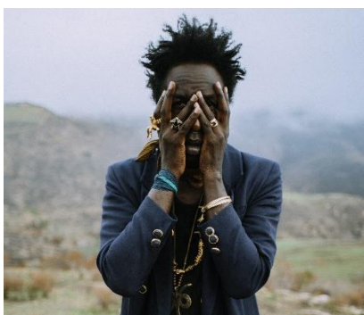
ソウル ウィリアムズ / Saul Williams

詩人、ラッパー、作詞家、音楽家、俳優、映画監督。ウィリアムズは映画「スラム」で俳優デビューし、デフジャムレコードのプロデューサー、ラッセルシモンズの HBO 番組「デフ・ポエトリー・ジャム」(2002–2007)、またモデルとしても活躍するなど多彩なアーティスト活動を現在でも行っている。これまでに 8 枚のアルバムをリリース。