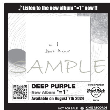
コースターデザイン

当イベントは、イアン・ギラン (vo)、ロジャー・グローヴァー (b)、イアン・ペイス (ds)、ドン・エイリー (key)、そして2022年加入のサイモン・マクブライド (g) というラインナップでは初のアルバムとなる、ディープ・パープル3年ぶりのオリジナルスタジオ作「=1」の8月7日リリースを記念したもので、ディープ・パープルの代表曲「SMOKE ON THE WATER」、「BURN」をイメージした各スペシャルカクテルを提供、これらカクテルご注文で、特製コースター（非売品）をプレゼントします。