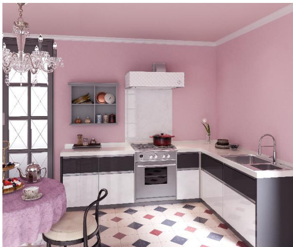
レンジフード「COULAH deco(カウラデコ)」設置イメージ

ライフスタイルにも個性や多様性が重要視される中、インテリアの選択肢も多岐にわたっています。このような背景から、フジオーショップでは、2022年12月よりレンジフードもお客様の様々なニーズにフレキシブルにお応えするために、45種類もの豊富なカスタムができる「COULAH(カウラ)」シリーズを開発・販売しています。今回新たに発売する「COULAH deco(カウラデコ)」が加わり、「COULAH(カウラ)」シリーズは選択肢がさらに拡充しました。