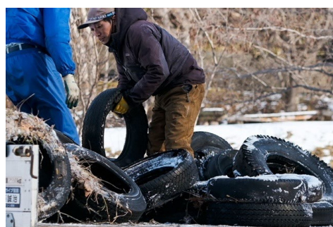
ゴミ拾いによる水質保全活動