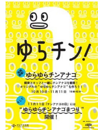
ゆらゆらチンアナゴまつり