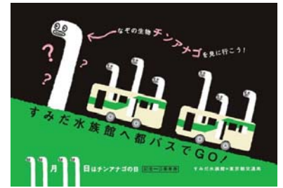
チンアナゴデザインの都バス一日乗車券