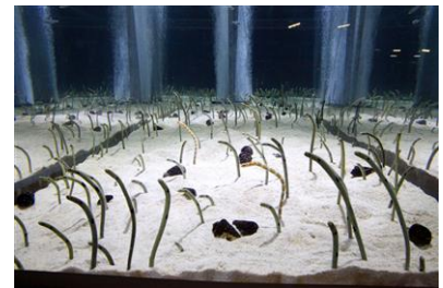
二人が愛を誓うチンアナゴ水槽