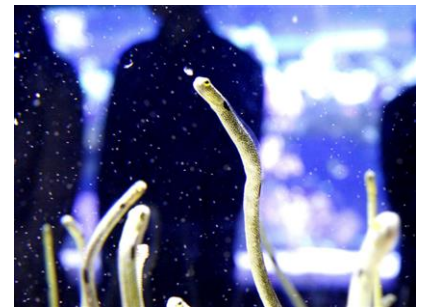
チンアナゴの「さあ、ゴハン！」

タイトル：なぞのせいぶつ？ゆらゆらチンアナゴ 開催期間：2014年10月10日(金)～11月30日(日)※11月11日(火)は除く 開催時間：各日18時45分～19時30分 開催場所：6階 チンアナゴ水槽前 参加定員：各回20名 参加対象：3歳以上 ※小学生未満は保護者同伴 参加料金：無料 参加方法：当日17時30分より館内インフォメーションで申し込み 内 容：謎の多いいきもの・チンアナゴを飼育スタッフと一緒に観察します。観察後はオリジナルのチンアナゴフィギュアを作ります。