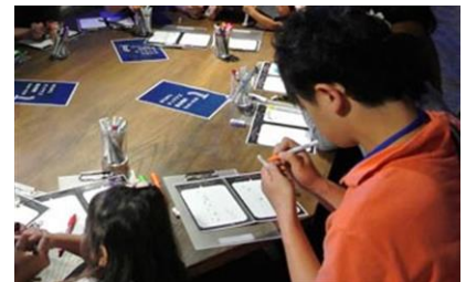
なぞのせいぶつ？ゆらゆらチンアナゴ

タイトル：なぞをときあかせ！チンアナゴ検定 開催期間：2014年11月1日(土)～11月30日(日) 開催時間：終日開催 開催場所：6階 チンアナゴ水槽付近 参加方法：当日受け付け 参加対象：小学生以上 参加料金：無料 開催内容：チンアナゴ博士を目指して検定にチャレンジ！チンアナゴ、ニシキアナゴ、ホワイトスポッテッドガーデンイール、マアナゴをよく観察すると答えが分かります。