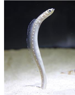
ホワイトスポッテッドガーデンイール

生物名：ホワイトスポッテッドガーデンイール 展示期間：2014年10月10日(金)～常時展示 展示場所：チンアナゴ水槽 生物紹介：東南アジアからインド洋にかけて分布し、サンゴ礁の細かい砂地に巣穴を掘り、群れを作ります。体は茶褐色で、側面に均等に白い点が並んでいます。エラ付近の大きな白い斑点が特徴。最大体長は約70cm。