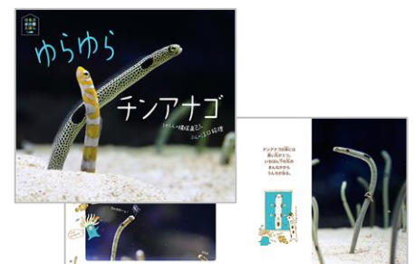
写真絵本「ゆらゆらチンアナゴ」

タイトル：ゆらゆらチンアナゴ 出版社：ほるぷ出版 発売日：2014年11月初旬 著者：(写真)横塚 眞己人、(文)江口 絵理 販売価格：1,300円(税抜き) 体裁：32ページ・オールカラー ※この絵本の90%の写真は、すみだ水族館で撮影されました。