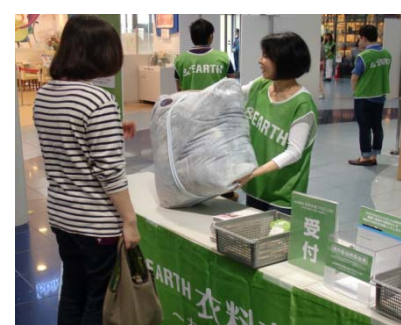
2014年5月(第11回)実施時の様子