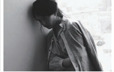
the last flower of the afternoon

中神一栄/KAZUE NAKAGAMI 国内のアパレルメーカー、ロンドンのコレクションブランド、国内のファッションブランドのパタンナーを経て2013年「ウェイ」を立ち上げる。独自のサイズ展開が特徴で、身体のサイズではなく、「どう着るか」でサイズを選ぶというブランドコンセプトで、着る行為そのものや出会い方を新しい切り口で伝えるブランド。