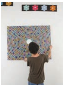
DIGINNER GALLERY WORKSHOP