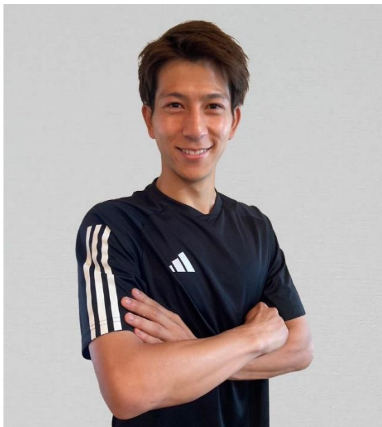
写真：奥抜 侃志選手 @UDN SPORTS

トライズ株式会社（本社：東京都港区、代表取締役社長：三木雄信）が展開する英語コーチングスクール「TORAIZ（トライズ）」は、ドイツの 1.FC ニュルンベルクに所属するプロサッカー 奥抜 侃志選手に、グローバルに活躍するアスリート向けの英語学習プログラム「グローバル・アスリート・プログラム」の提供を 2024 年 7 月 3 日より開始しました。