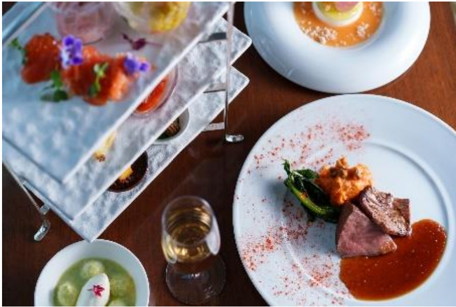
「Sendai Delicious Moment ～Summer Vacation～」イメージ